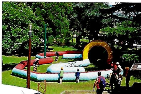
Animation enfants moto électrique gratuite

Podium/remise de prix en compagnie de B. Laget